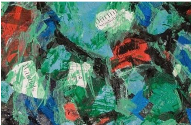
Das Misereor Hungertuch 2023 "Was ist uns heilig?" von Emeka Udemba © Misereor

Het dooit Het druppelt Het gutst Het stroomt Het overstroomt Het gaat onder